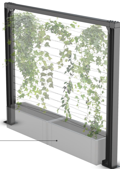
Stilo planter 06.048.L (sold separately)